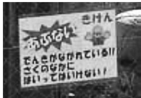
事故後の注意喚起状況

今回の事故は、想定外の方法により被災者が送電鉄塔に昇塔してしまったために発生しました。事故の原因を究明する段階で、昇塔経路が推定されました。実際、現場の人間で同様の方法で昇塔できた人はいなかったようです。被災者が小柄だったため昇塔が可能となったと思われます。また、送電線の設置場所が市街地から少し離れた河口付近にあったため、被災者は、景色がきれいだろうと思って昇塔した可能性も考えられます。当該場所と同じような環境に送電線を設置されている方々は、再度、昇塔が可能かどうかを、検討していただき、類似事故の未然防止に努められるようお願いします。