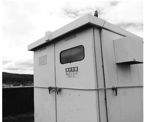
屋上キュービクル

電気事故関係等を掲載している九州産業保安監督部のホームページアドレス http://www.safety-kyushu.meti.go.jp/denki/jiko.htm